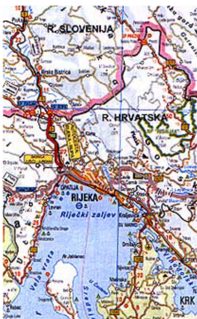
Položai autoceste Rupa – Rijeka

Strategija prostornog uređenja i Strategija prometnog razvoja Republike Hrvatske utvrdile su izgradnju jad-