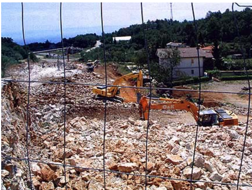
Početak radova na dionici Jušići – Jurdani