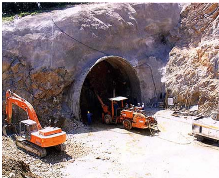
Početak proboja tunela na Jurdani